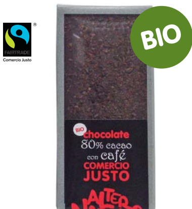
Chocolate 80% cacao con Café

Chocolates Artesanos: 100% Comercio Justo, 100% Biológico, 100% Local