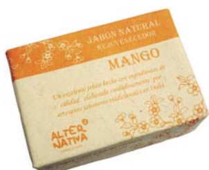
Jabón mango cod. 594393K 100g