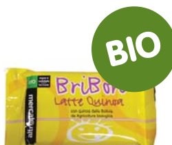
Bribón chocolate leche y quínu