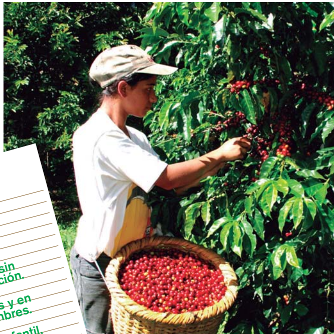
Recolección de café Cecocafen, Nicaragua.

Reinversión de los beneficios obtenidos por la venta de los productos en proyectos de mejora y desarrollo en la propia comunidad.