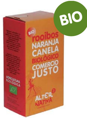
Naranja-canela cod. 011103 K 30g 20 bolsitas de filtro

La canela y la corteza de naranja aportan un aroma y sabor ligeramente agridulce que añade a este rooibos un toque exótico y original.