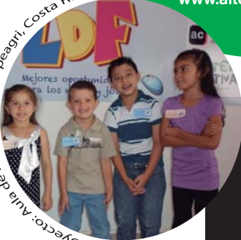
Proyecto: Aula de Informática. Coopeagri, Costa Rica.