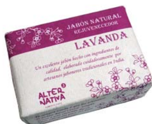
Jabón lavanda cod. 594396K 100g