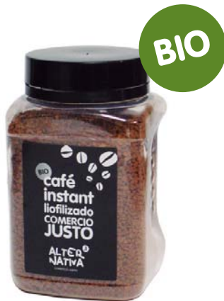
Café liofilizado cod. 008008K pet 100g