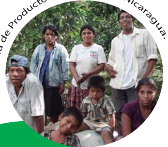
Familia de Productores. Cecocafen, Nicaragua.

El Comercio Justo es una alternativa al comercio tradicional basado sólo en el beneficio económico. El comercio justo busca el bienestar social y el respeto al medio ambiente y ofrece un método sencillo y directo para mejorar la situación de las organizaciones productoras.