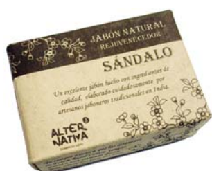
Jabón sándalo cod. 594390K 100g

Tu compra ayuda a que los artesanos de Palam Rural Centre tengan acceso a una vivienda digna, agua, educación para sus hijos y asistencia sanitaria. Esta cooperativa está formada por un grupo de familias Harijan, de las castas más bajas de la sociedad hindú, al estado de Tamil Nadu, al sur del India, los intocables. Gracias a las redes de Comercio Justo, han conseguido levantar un centro médico y escuelas, algo impensable para esta casta en otros tiempos.