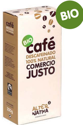
Descafeinado cod. 003407 K 250g Tueste 100% natural

Café elegante, suave y de agradable fragancia. Descafeinado sin utilizar productos químicos agresivos para el medio ambiente y las personas. Mantiene intactas las mejores cualidades de los grandes cafés.