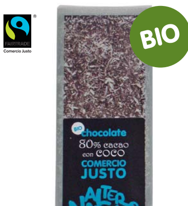
Chocolate 80% cacao con Coco