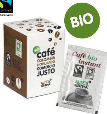
Café liofilizado sobres monodosis cod. 008016K pack 10 sobres cod. 008015 caja 375 sobres