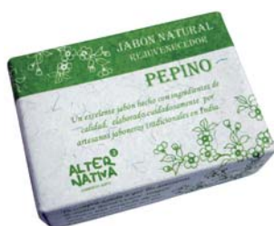
Jabón pepino cod. 594391K 100g