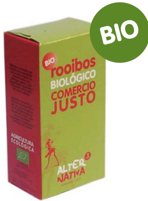
Natural cod. 011101 K 30g 20 bolsitas de filtro

Sabroso y aromático, de color caoba, intenso aroma, con un delicioso sabor y propiedades saludables. Se puede servir tanto frío como caliente, con o sin azúcar.