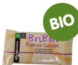
Bribón chocolate blanco y quínu