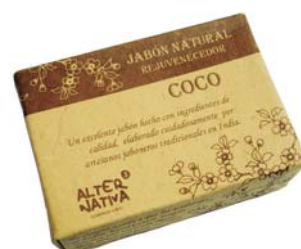
Jabón coco cod. 594392K 100g