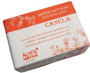
Jabón canela cod. 594397K 100g