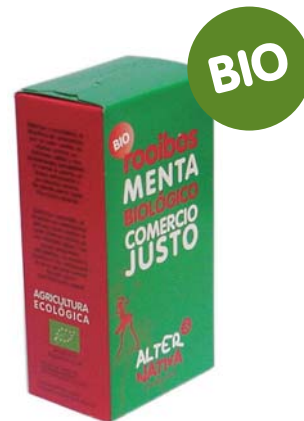
Menta cod. 011106 K 30g 20 bolsitas de filtro

La menta le aporta un toque refrescante y su peculiar aroma.