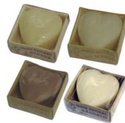
Jabones corazón cod. 594370K sándalo 50g cod. 594372K coco 50g cod. 594373K mango 50g cod. 594376K lavanda 50g