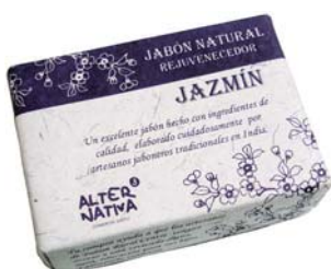
Jabón jazmín cod. 594394K 100g