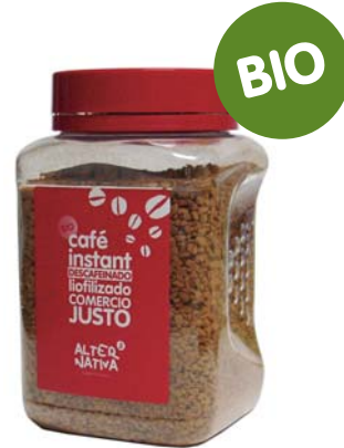
Café liofilizado descafeinado cod. 008029K pet 100g

Café elegante, suave y de agradable fragancia. Descafeinado sin utilizar productos químicos agresivos para el medio ambiente y las personas. Mantiene intactas las mejores cualidades de los grandes cafés.