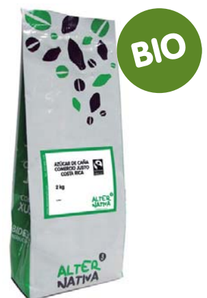
Café liofilizado biológico cod. 008007K bolsa 500g

Nuestro café liofilizado ha sido sometido a los más modernos procesos de solubilización de café, de forma que el producto final conserva todas sus excelentes propiedades de aroma, sabor y color.