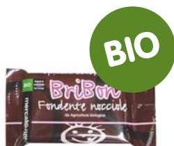
Bribón chocolate negro avellanas

Chocolatinas bribón Las chocolatinas Bribón de Comercio Justo son excelentes productos en relación calidad-precio. Contienen siempre el máximo posible de ingredientes de Comercio Justo, a la vez que son asequibles para todos los bolsillos y de una elevada calidad, por lo que son un snack ideal para compatibilizar el día a día con el consumo responsable