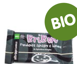
Bribón chocolate negro con limón y jengibre