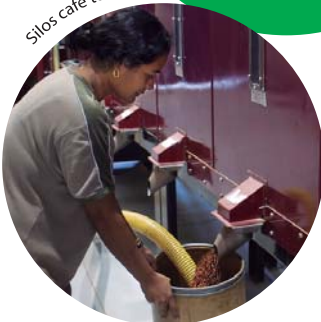
Silos café tostado.

Importamos café verde de cooperativas de productores de muy diversas procedencias: Colombia, Méjico, Nicaragua, Guatemala, Bolivia, Costa Rica, Perú, Brasil, Tanzania, Uganda, Etiopía, Indonesia... Lo que nos permite ofrecer una amplia gama de cafés de excelente selección, para cubrir las necesidades de cada uno de nuestros clientes.