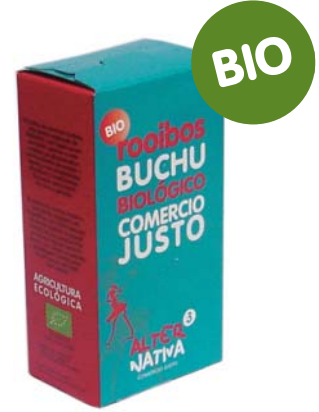
Buchu cod. 011104 K 30g 20 bolsitas de filtro

El buchu es, como el rooibos, una planta originaria de Sudáfrica. Las hojas secas de buchu aportan un característico aroma mezcla de romero y menta, y sus propiedades diuréticas y medicinales.