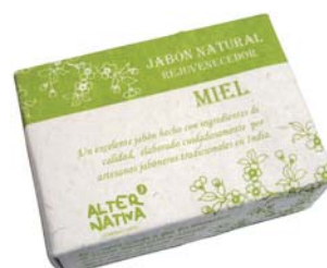
Jabón miel cod. 594395K 100g