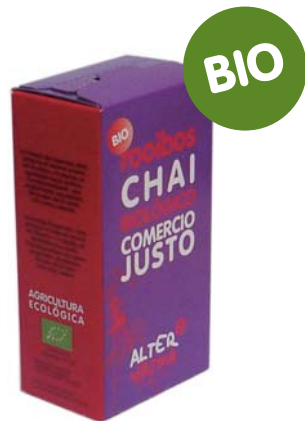
Chai cod. 011105 K 30g 20 bolsitas de filtro

El Chai es una mezcla de especias típica de la India, que potencia el intenso aroma del Rooibos y le aporta un agradable toque exótico.