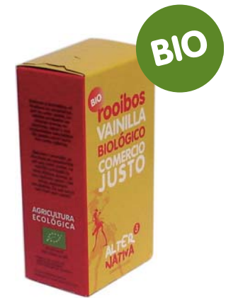
Vainilla cod. 011107 K 30g 20 bolsitas de filtro

La vainilla enriquece este rooibos con su intenso aroma, su delicioso sabor y sus propiedades saludables.