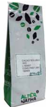
Chocolate especial vending cod. 042410K 1 Kg

Idóneo para máquinas de vending (contiene leche). Para preparar un excelente chocolate a la taza.