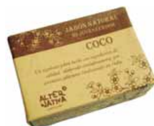
Jabón coco cod. 594392K 100g