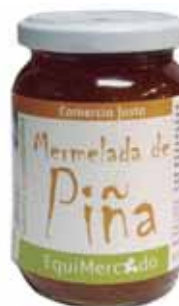
Mermelada Piña cod. 053302K frasco de vidrio 300g