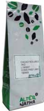
Cacao puro cod. 047704K 1 Kg

100% cacao desgrasado. Sin aromatizantes ni espesantes, ni azúcares añadidos. De excelente calidad, ideal para elaborar pasteles y postres o un delicioso chocolate a la taza.