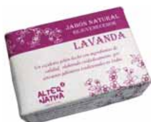
Jabón lavanda cod. 594396K 100g