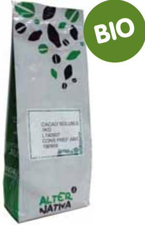
Cacao BIO puro cod. 047703K 1 Kg

100% cacao biológico desgrasado. Sin aromatizantes ni espesantes, ni azúcares añadidos. De excelente calidad, ideal para elaborar pasteles y postres o un delicioso chocolate a la taza.