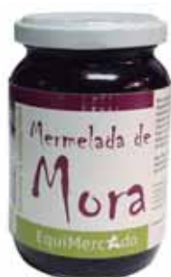
Mermelada Mora cod. 053300K frasco de vidrio 300g

Producidas por la "Asociación de trabajadoras autónomas La Dolorosa de Facundo Vela", que está ubicada en la provincia de Bolívar, en Ecuador. Para todas las mermeladas, las mujeres de la cooperativa eligen los mejores frutos.