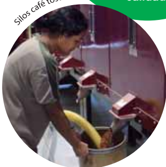
Silos café tostado.

Importamos café verde de cooperativas de productores de muy diversas procedencias: Colombia, Méjico, Nicaragua, Guatemala, Bolivia, Costa Rica, Perú, Brasil, Tanzania, Uganda, Etiopía, Indonesia... Lo que nos permite ofrecer una amplia gama de cafés de excelente selección, para cubrir las necesidades de cada uno de nuestros clientes.