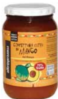
Mermelada Mango cod. 056802K frasco de vidrio 400g

Estas mermeladas tienen un agradable sabor dulce y un aroma afrutado, una textura suave con deliciosos trozos de frutas. Las frutas empleadas en la elaboración de estas mermeladas son todas frutas frescas de cultivo orgánico, mientras que el azúcar es integral de caña. Este producto no tiene ningún tipo de conservante o colorante artificial, sino que el proceso de producción es artesanal y preserva el medio ambiente: los mangos y papayas frescos son seleccionados, lavados, pelados, cortados en pequeños trozos; después son cocinados, hirviéndolos a fuego lento durante horas, añadiendo poco a poco el azúcar de caña.