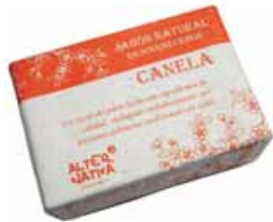
Jabón canela cod. 594397K 100g