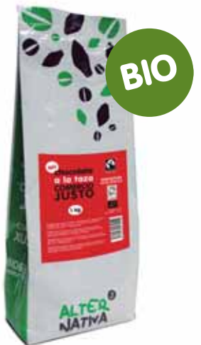
Chocolate BIO a la taza cod. 042402K 1Kg

Para preparar rápida y fácilmente un delicioso chocolate a la taza. Con cacao y azúcar de comercio justo y agricultura ecológica.