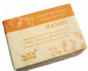
Jabón mango cod. 594393K 100g