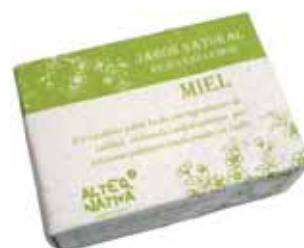
Jabón miel cod. 594395K 100g