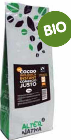
Cacao BIO instant cod. 042308K 1Kg

Cacao instantáneo de agricultura biológica. De inmediata disolución tanto en leche fría como caliente. Cuida tu alimentación mejorando tu salud y la del planeta.