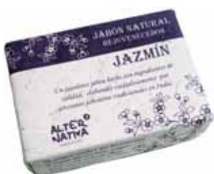
Jabón jazmín cod. 594394K 100g