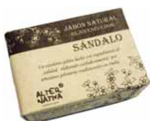
Jabón sándalo cod. 594390K 100g

Tu compra ayuda a que los artesanos de Palam Rural Centre tengan acceso a una vivienda digna, agua, educación para sus hijos y asistencia sanitaria. Esta cooperativa está formada por un grupo de familias Harijan, de las castas más bajas de la sociedad hindú, al estado de Tamil Nadu, al sur del India, los intocables. Gracias a las redes de Comercio Justo, han conseguido levantar un centro médico y escuelas, algo impensable para esta casta en otros tiempos.