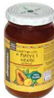
Mermelada Papaya cod. 056801K frasco de vidrio 400g