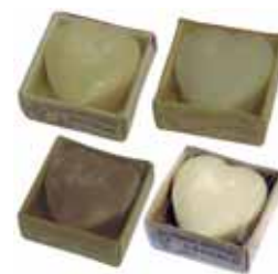
Jabones corazón cod. 594370K sándalo 50g cod. 594372K coco 50g cod. 594373K mango 50g cod. 594376K lavanda 50g