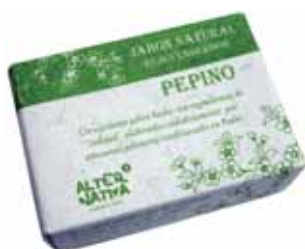
Jabón pepino cod. 594391K 100g