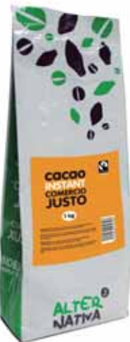
Cacao instant cod. 042307K 1Kg

Cacao instantáneo de exquisito sabor y alto valor social. De inmediata disolución tanto en leche fría como caliente. Ideal para disfrutar de nutritivos desayunos y meriendas.