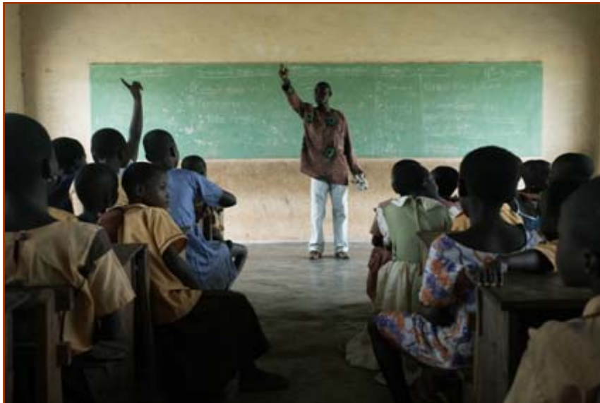
Escola de Ghana

Es prohibeix l'exploració infantil i es fomenta l'educació.