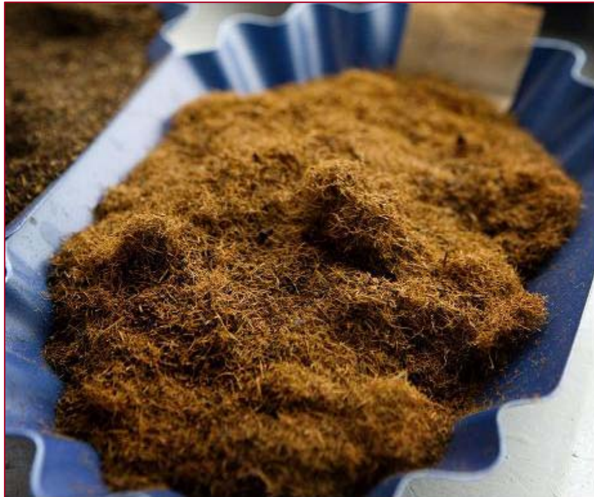
Fulles de te processades