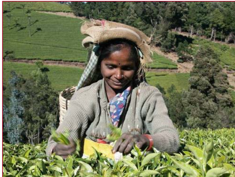
Una recolectora recollint fulles de te